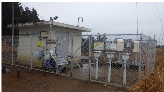
(写真1) モニタリングポストNo. 1