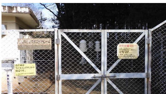
(写真5) モニタリングポストNo. 4 (写真手前側が県道)