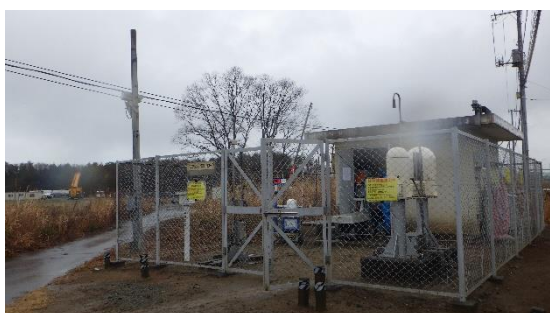
(写真2) モニタリングポストNo. 2