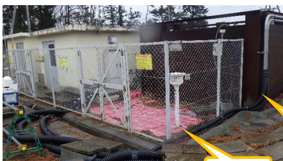
(写真3-1) モニタリングポストNo. 8 (線量率測定器は遮蔽壁内に設置されている)