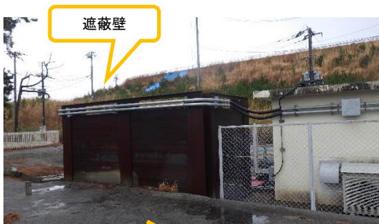
(写真3-2) 同上(周囲はフェーシングがなされている)