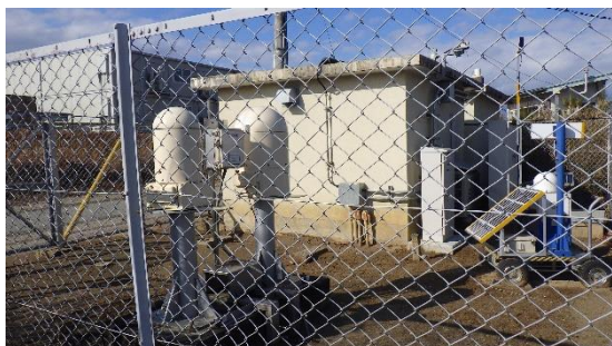
(写真4) モニタリングポストNo. 3 (左側に見えるのは県道)