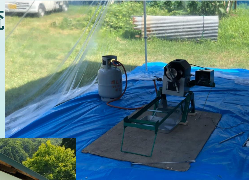
↑ そばポンをつくる機械