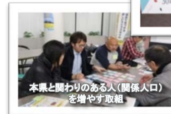
本県と関わりのある人(関係人口)を増やす取組