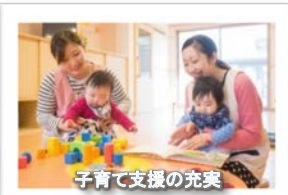
子育て支援の充実