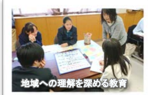
地域への理解を深める教育