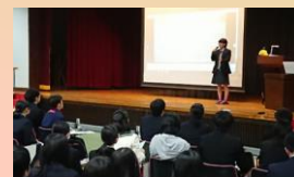
オールふくしまリーダー 育成プロジェクト

難関大学への進学を志望する生徒を対象として合同学習会を開催し、生徒の志を高めるとともに、各校における理数教育や思考力等を育む取組を支援することで、本県で学ぶ高校生の学力向上を推進します。