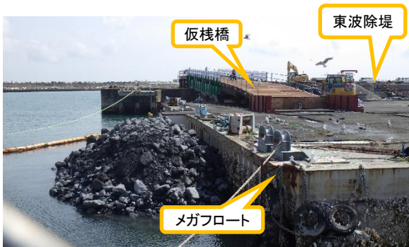
(写真1) 仮棧橋の設置状況 (メガフロート北側)