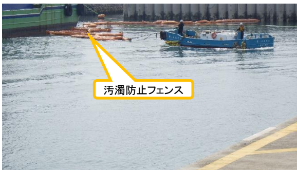
(写真2) 汚濁防止フェンス設置作業の状況