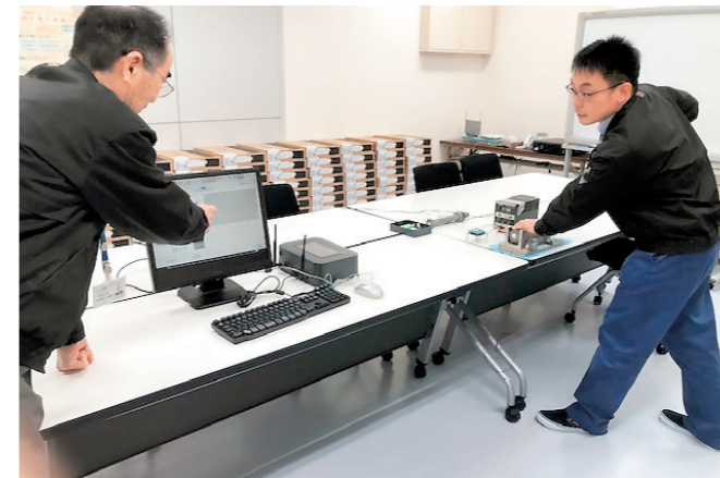
ネジの締め具合、及び、データ通信状態を観察している様子