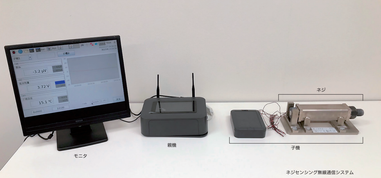
ネジセンシング無線通信システム