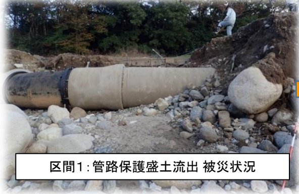
区間1: 管路保護盛土流出 被災状況