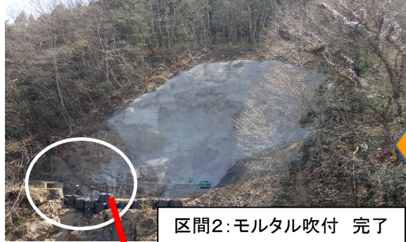
区間2: モルタル吹付 完了