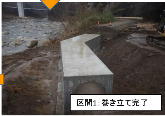
区間1: 巻き立て完了