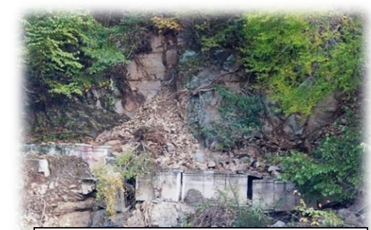
区間2: 水路・法面崩落 被災状況