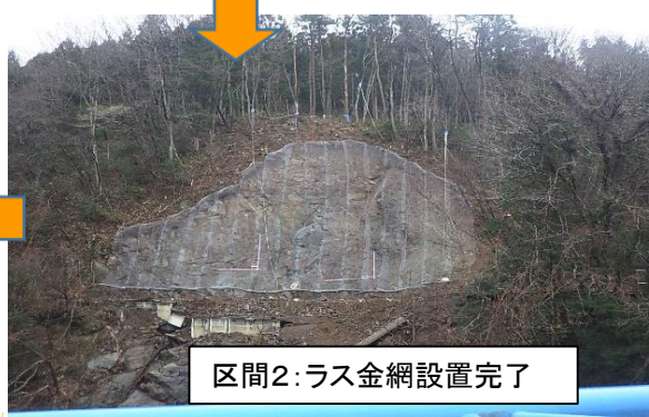
区間2: ラス金網設置完了