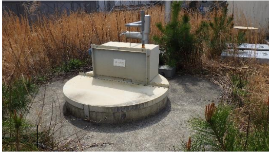
(写真1-1) サブドレン設備の一例① (5号機廃棄物処理建屋北西側)