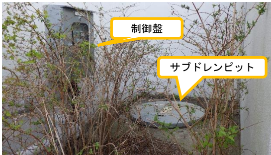
(写真1-2) サブドレン設備の一例② (5号機廃棄物処理建屋北側)