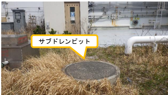
(写真2) 埋め立てられたサブドレンピットの 一例 (5号機原子炉建屋南西側)