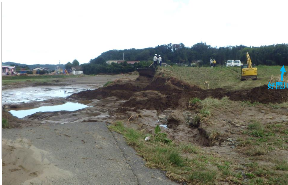
被災状況 (令和元年10月13日撮影)