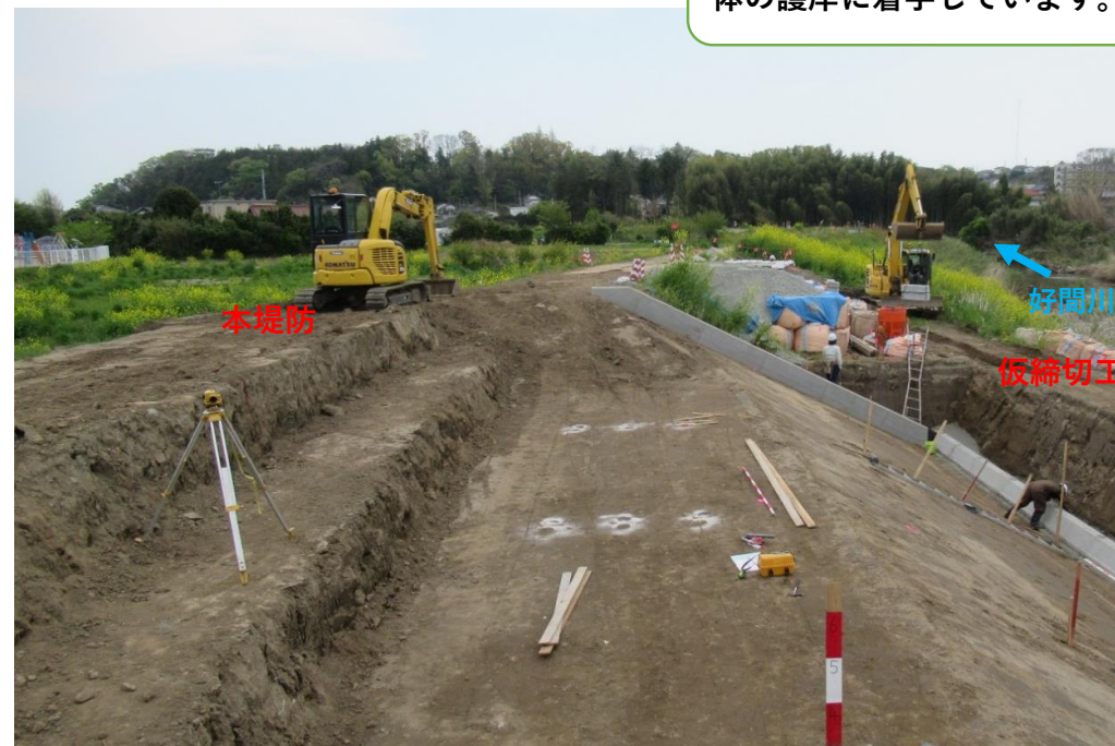
仮堤防設置完了、堤防盛土施工中