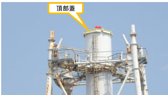
(写真 1 - 4) 頂部蓋設置後の状況