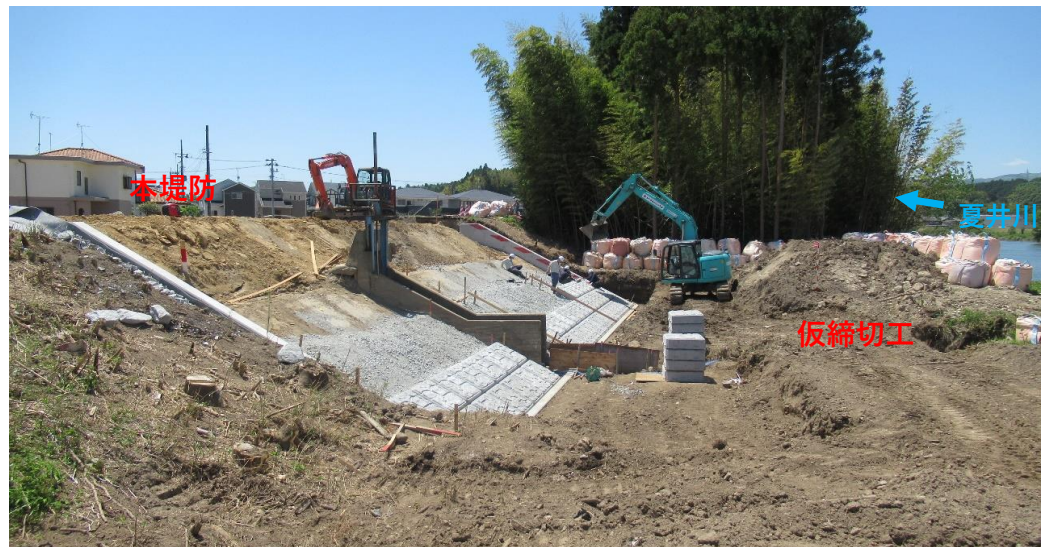
堤防護岸 コンクリート張ブロック施工中 施工状況 (令和2年5月15日)