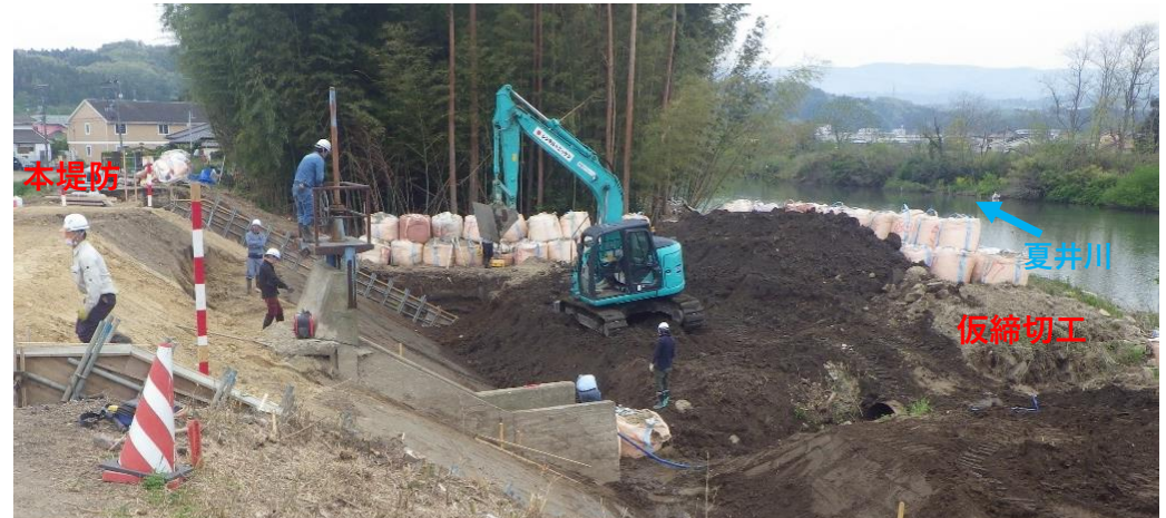
堤防護岸 コンクリート張ブロック施工中 施工状況 (令和2年4月27日)