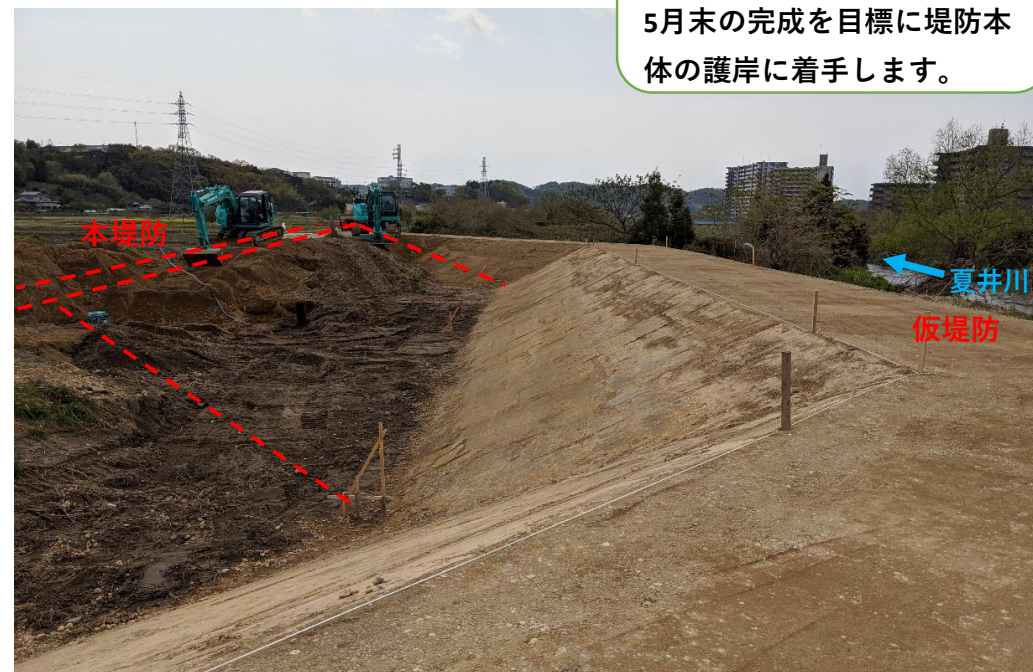
仮堤防設置完了、堤防盛土施工中