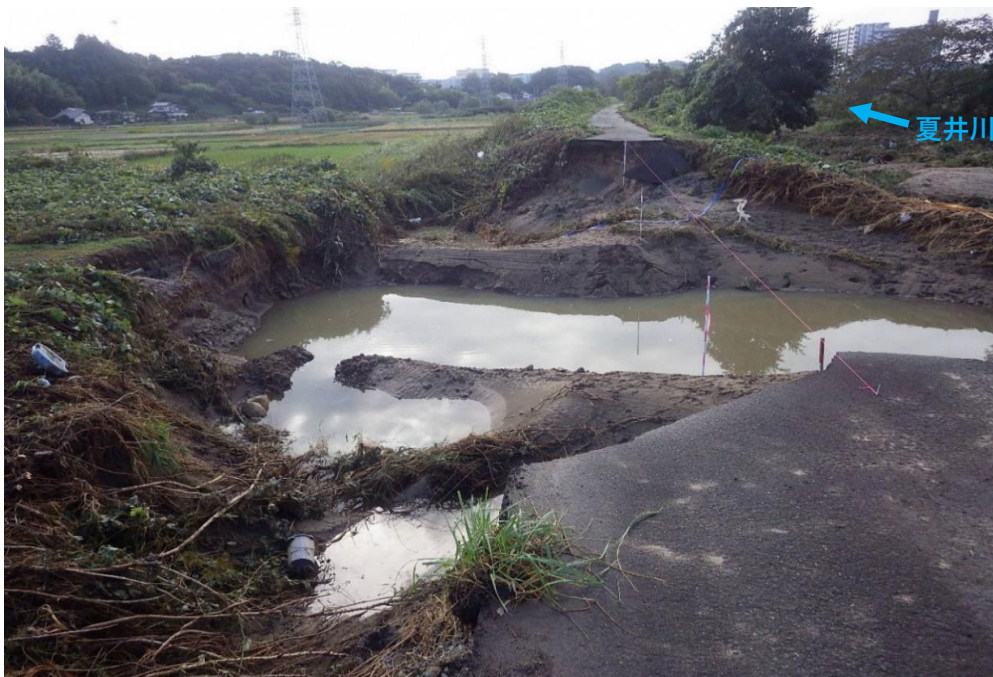
被災状況 (令和元年10月13日撮影)

堤防本体を復旧する前に堤防前面に仮堤防を設置しました。5月末の完成を目標に堤防本体の護岸に着手します。