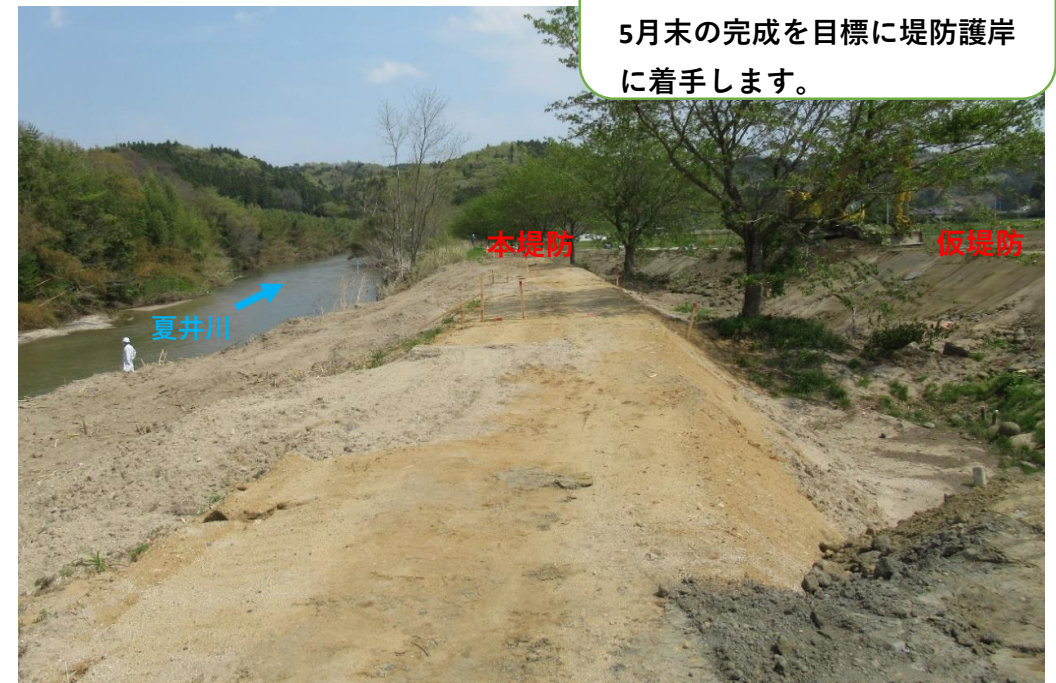
仮堤防設置完了、堤防盛土施工中