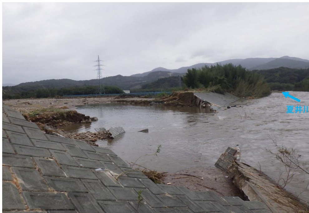
被災状況 (令和元年10月13日撮影)