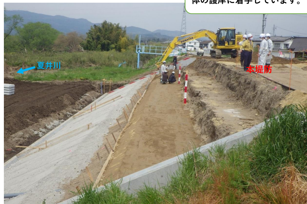
堤防護岸 コンクリート張ブロック施工中 施工状況 (令和2年4月27日)