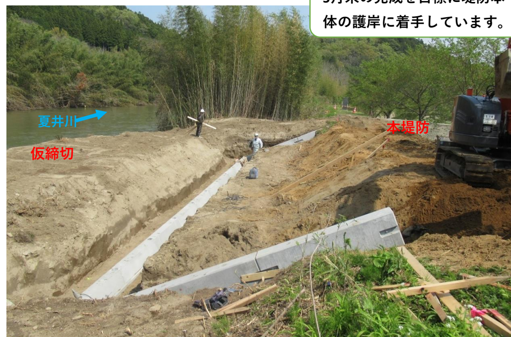
堤防護岸 コンクリート張ブロック施工中