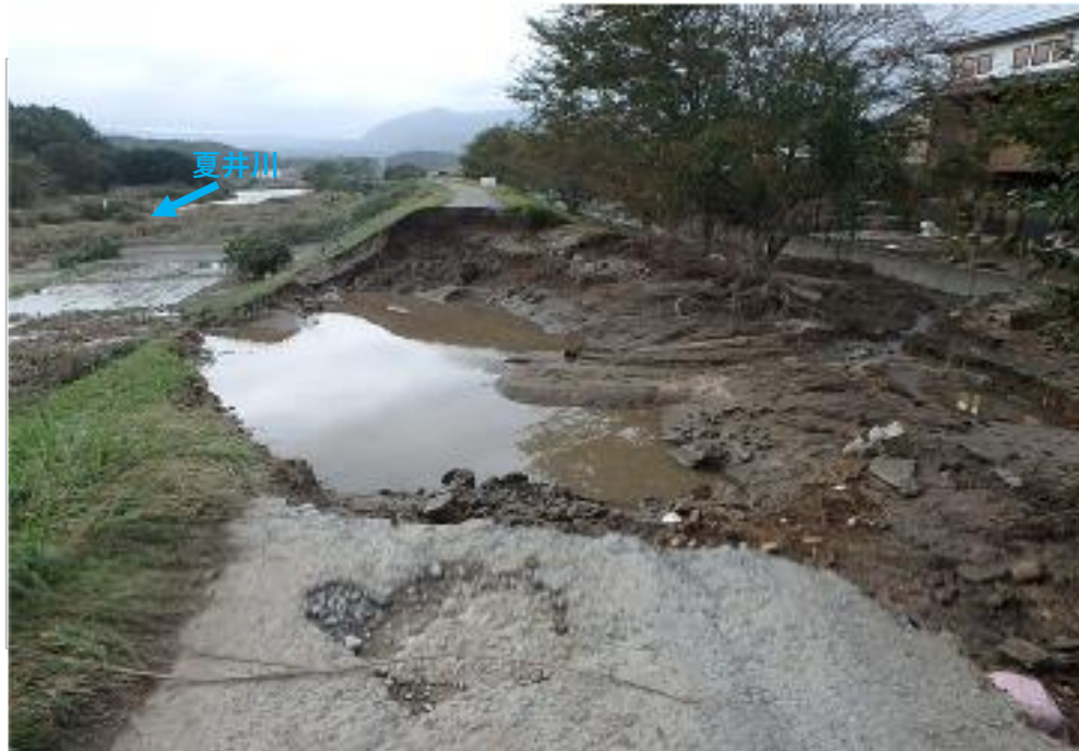
被災状況（令和元年10月13日撮影）