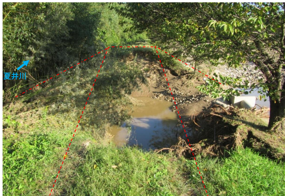
被災状況 (令和元年10月14日撮影)