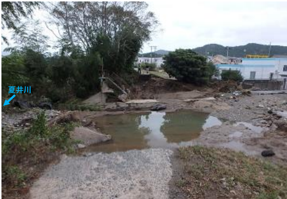
被災状況 (令和元年10月13日撮影)