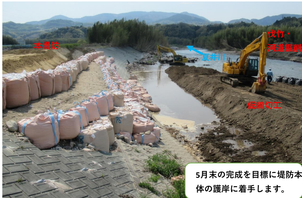
仮堤防設置完了、堤防盛土施工中