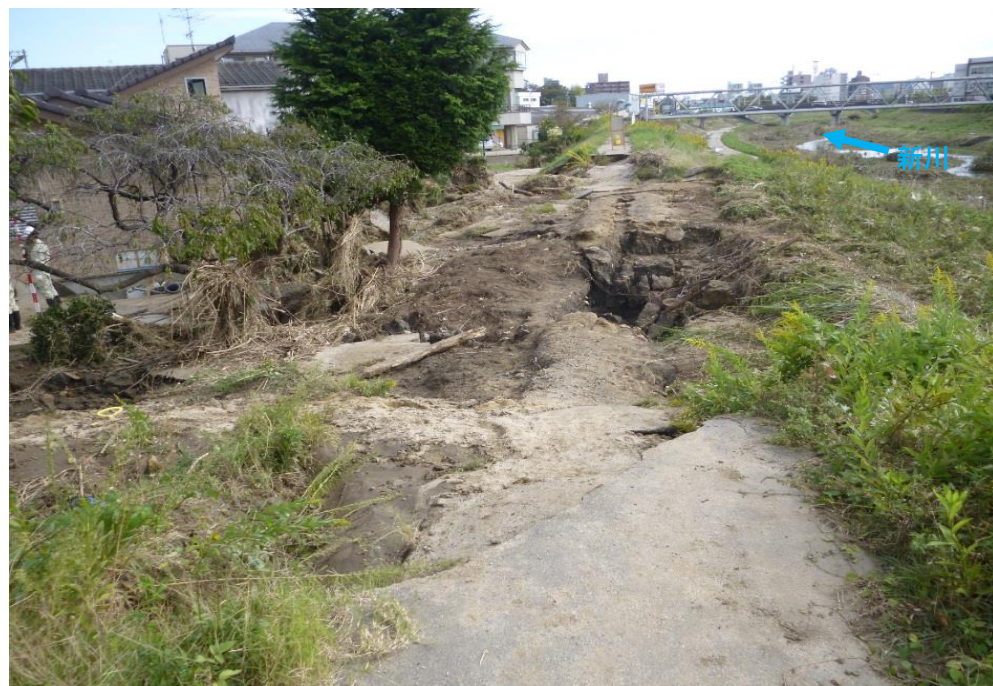
被災状況（令和元年10月14日撮影）