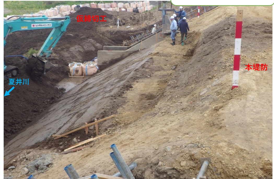
堤防護岸 コンクリート張ブロック施工中