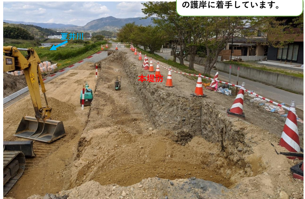
堤防護岸 コンクリート張ブロック施工中 施工状況（令和2年4月27日）