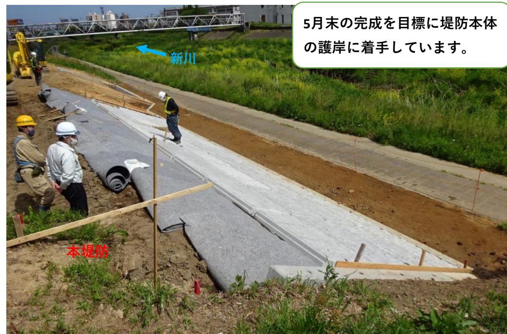
堤防コンクリート張ブロック施工中