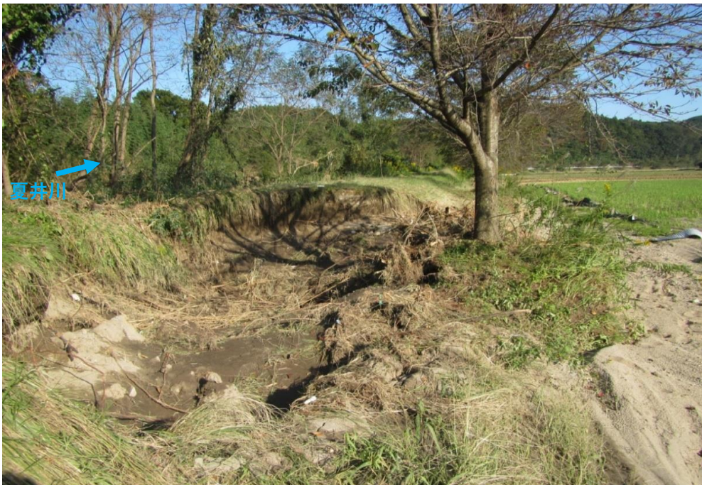
被災状況 (令和元年10月14日撮影)

堤防本体を復旧する前に堤防背面に仮堤防を設置しました。 5月末の完成を目標に堤防護岸に着手します。