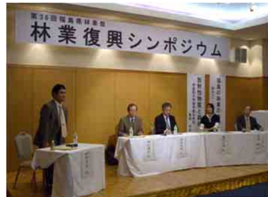
林業祭(林業復興シンポジウム)の開催状況