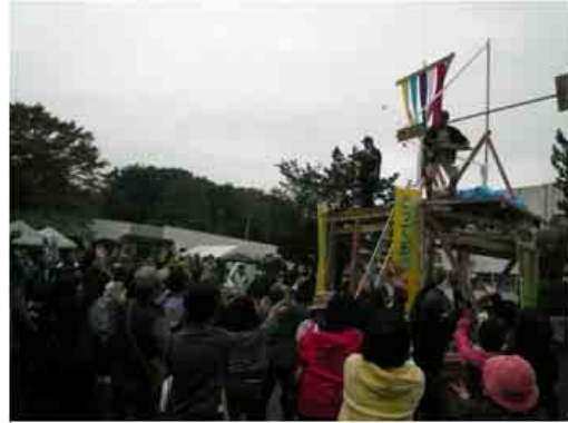
住宅モデルを展示したイベント(林業祭)の様子