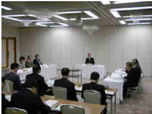
第1回森林の未来を考える懇談会開催の様子