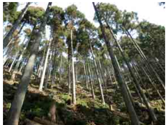
森林整備(間伐)実施状況