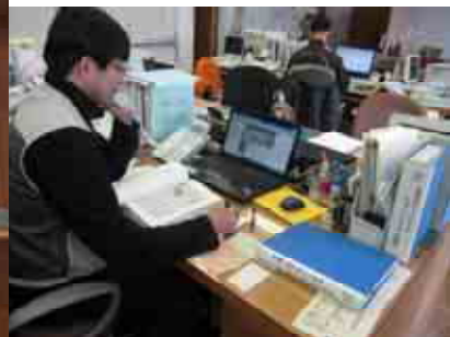
森林ボランティアサポートセンター活動の様子