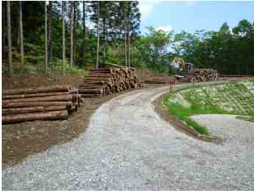
間伐材搬出支援事業による間伐材集積の様子