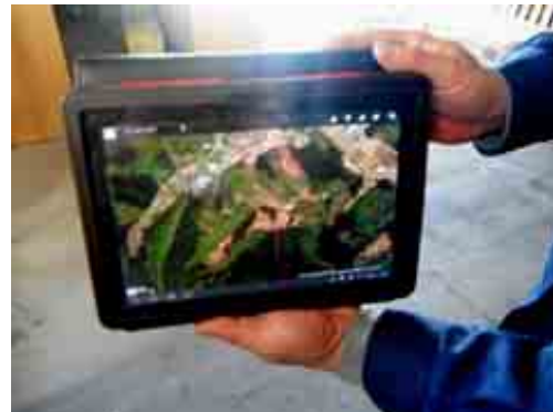
タブレット型PCで空中写真を表示