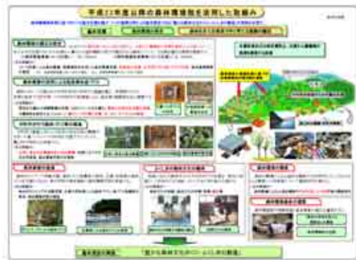
県ホームページによる広報内容