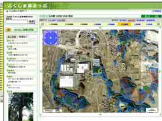
「ふくしま森まっぷ」による森林情報の表示