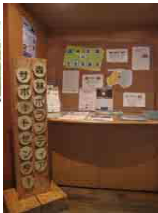
「フォレストパークあだたら」に開設された森林ボランティアサポートセンター