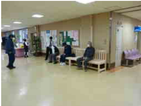
「ほっと」スペース創出事業 埼玉厚生病院待合室に設置した 木製イスを利用されている様子

木質バイオマスエネルギー利用機器(ペレットストーブ、薪ストーブ、補助額:5万円/台)の民間における導入支援(35台)を行った。