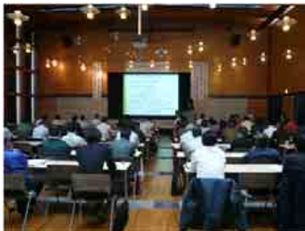
木質バイオマス利活用促進事業 (シンポジウム)開催の様子