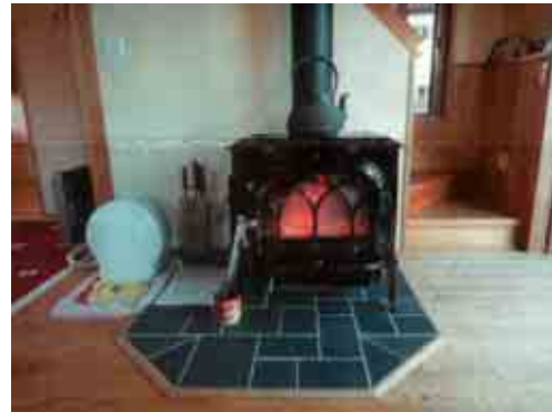
バイオマス暖房でCO 2 ダイエット事業 個人住宅への導入を支援した 薪ストーブ