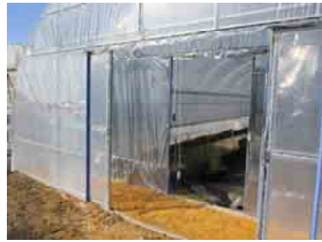
ミストハウスの整備状況