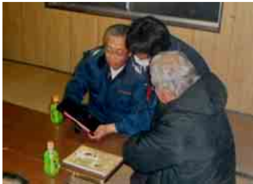
タブレット型PCを活用した、森林所有者への説明の様子