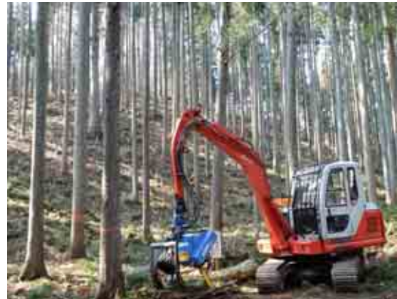
林業機械による間伐材搬出の様子