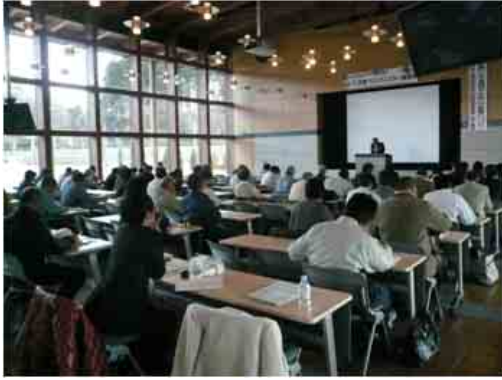
ふくしま家づくりマイスター講習会の様子