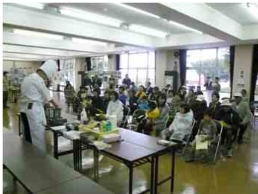
林業祭(きのこ料理教室)の様子