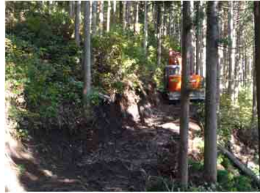
間伐材搬出支援事業による作業路整備の様子