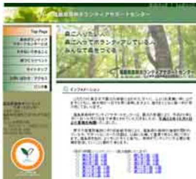
森林ボランティアサポートセンターのHP