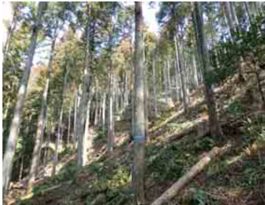
森林整備(間伐)実施状況