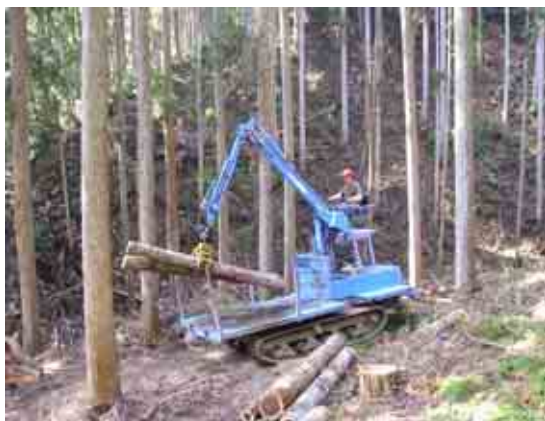
林業機械による間伐材搬出の様子