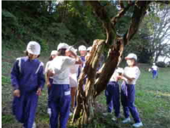
森林環境基本枠を活用した自然観察会の様子