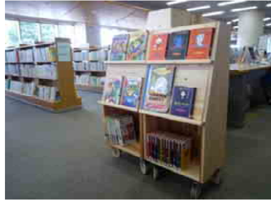
地域提案重点枠による書架の導入状況