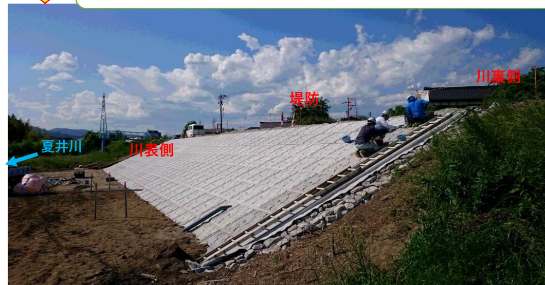
川表側 コンクリート張ブロック完了