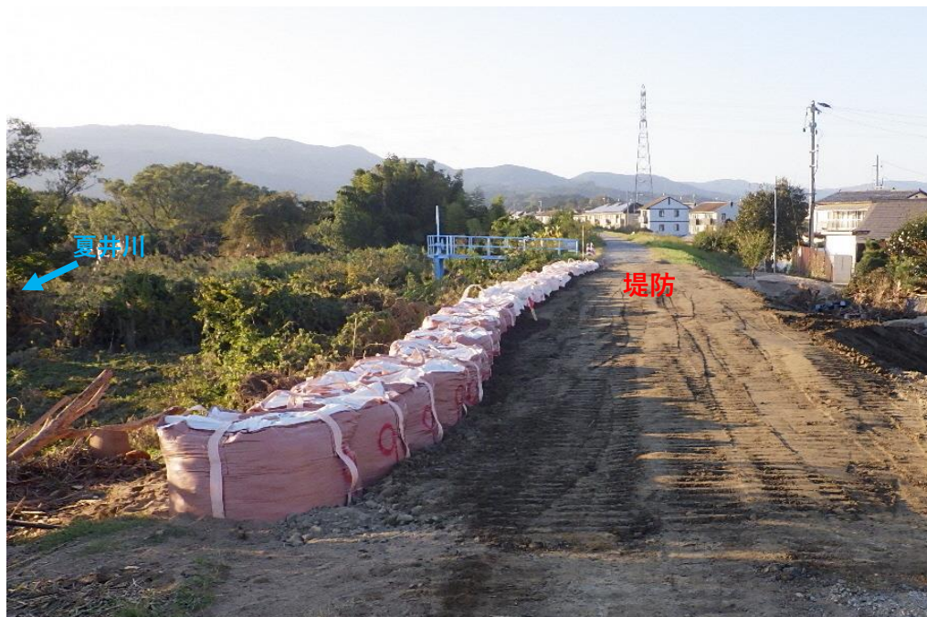
被災状況 (応急仮工事後)

川表側破堤部の護岸が、5月末に完了しました。引き続き、川裏側の護岸と天端舗装工について整備していきます。