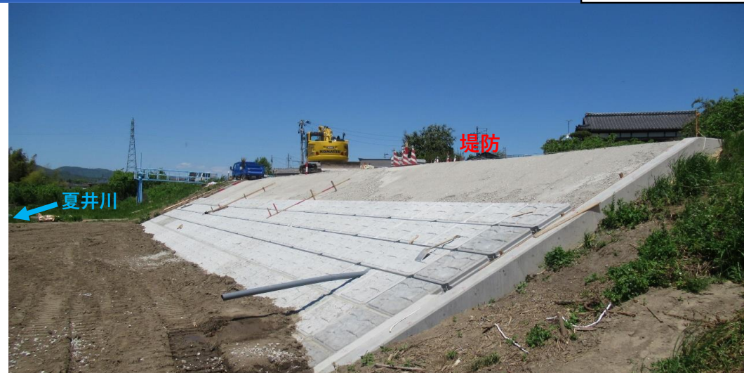
川表側 コンクリート張ブロック施工中