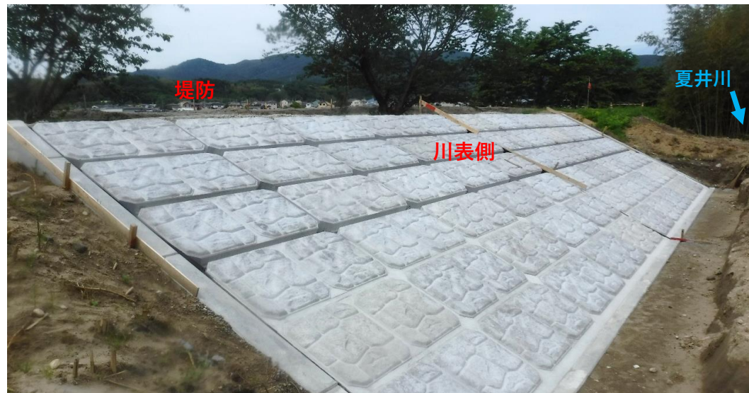
川表側 コンクリート張ブロック完了