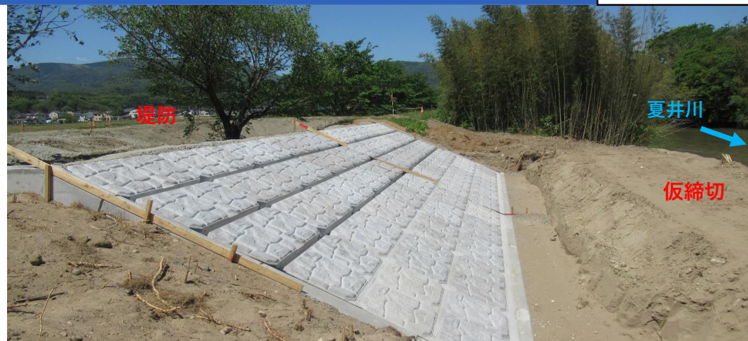
川表側 コンクリート張ブロック施工中