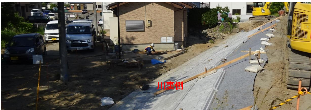
川裏側 コンクリート張ブロック施工状況

川表側破堤部の護岸が、5月末に完了しました。引き続き、川裏側の護岸と天端舗装工について整備していきます。