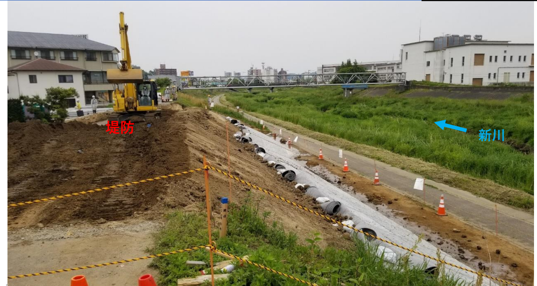
堤防盛土、コンクリート張ブロック施工中