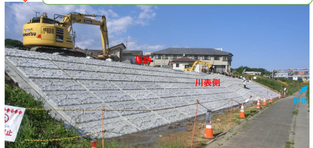
川表側 コンクリート張ブロック完了