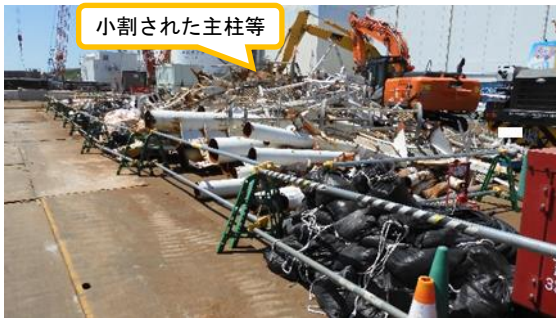
(写真2) 主柱等仮置き状況