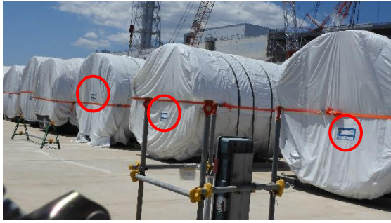
(写真1) 筒身仮置き状況 赤丸部分が空間線量率測定結果表示箇所