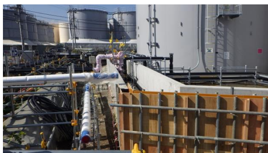
（写真2-1）エリア南側の堰の状況