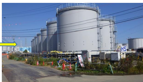
（写真1-2）平成30年10月25日撮影