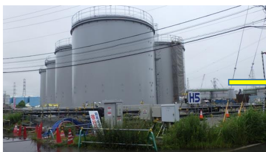
（写真1-1）平成30年7月6日撮影