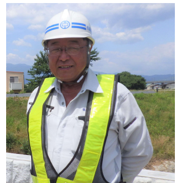
佐藤建材工業（株） 現場代理人

現在は対岸の堤防舗装工事をしています。暑い日や雨の日など、いろいろありますが地域の安全安心が第一ですから。現場全員が使命感を持ってやっています。