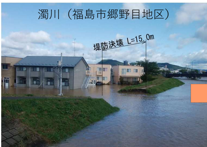
濁川（福島市郷野目地区）

国道115号濁川橋下流（福島市郷野目地区）。 合流する阿武隈川の増水に備えて阿武隈川と同じ高さに堤防を嵩上げしました。