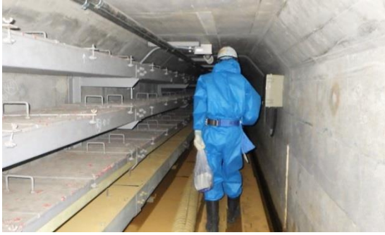
(写真 2 - 1) CV洞道内の状況