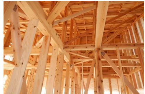
■ ポイント交付住宅

イ 県産材を活用した住宅の新築・増改築及び購入に対しポイント交付や地域住宅生産者の活動への支援