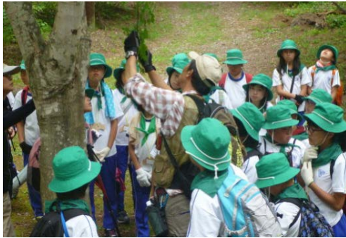
■ 森林環境学習を支援（森林環境基本枠）

道沿線の森林の整備など、地域の課題に対応した森林整備の実施のほか、図書館や公民館等の市町村有施設や、小中学校や幼稚園等の保育施設において、県産材を使った机や椅子等の導入や内装木質化などが実施された。