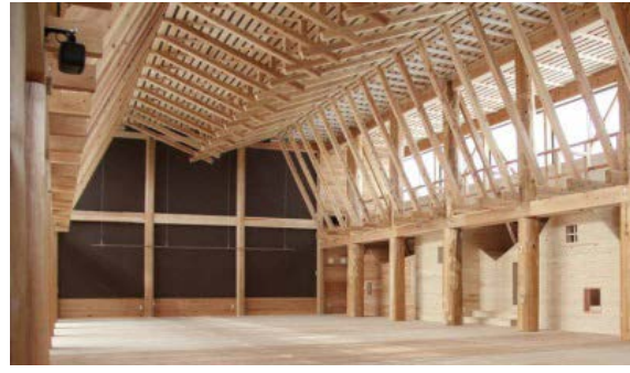
■ 県産材の利活用推進（地域提案重点枠）