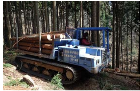
■ 間伐材搬出の支援