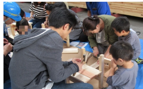
■ 木とのふれあい創出

2020 大会選手村ビレッジプラザの建築部材 113m 3 使用。大会関連施設に県内小中学校児童生徒が関わり木製ベンチ 250 脚を製作。