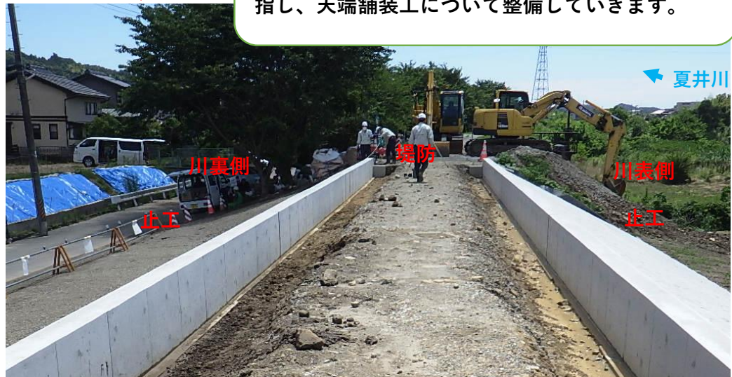
川表側、川裏側護岸工完了 天端作業状況 (令和2年6月29日撮影)