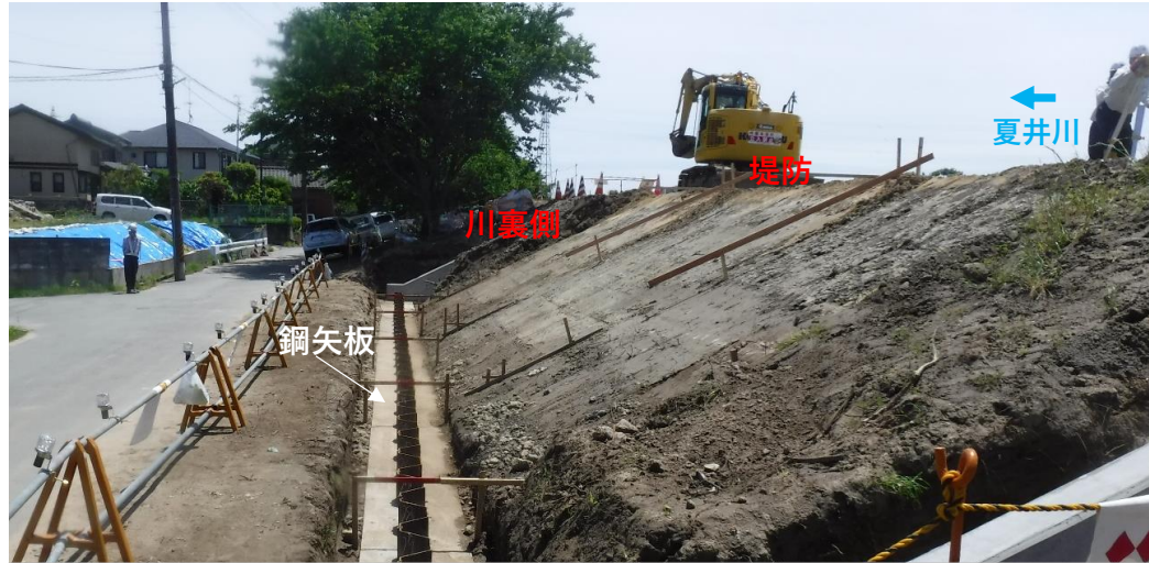
川裏側 鋼矢板打設完了 (令和2年5月29日撮影)