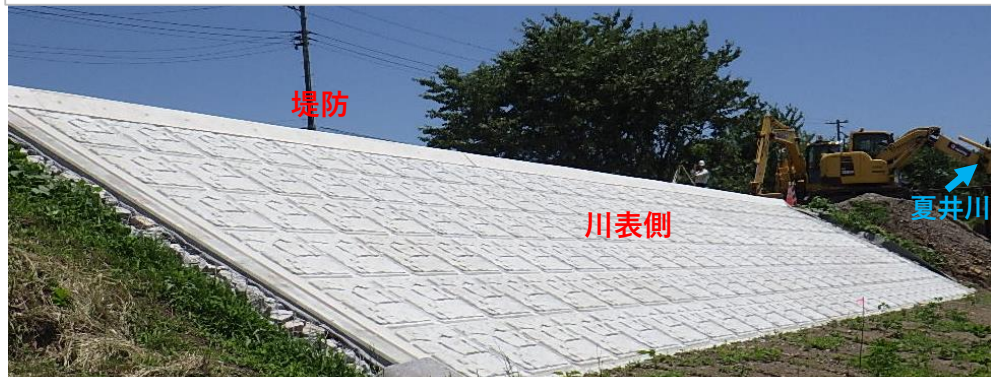
川表側 護岸工完了 (令和2年6月29日撮影)

5月末に川表側の護岸が完成し、6月末に川裏側の護岸が完成しました。引き続き、早期の完成を目指し、天端舗装工について整備していきます。