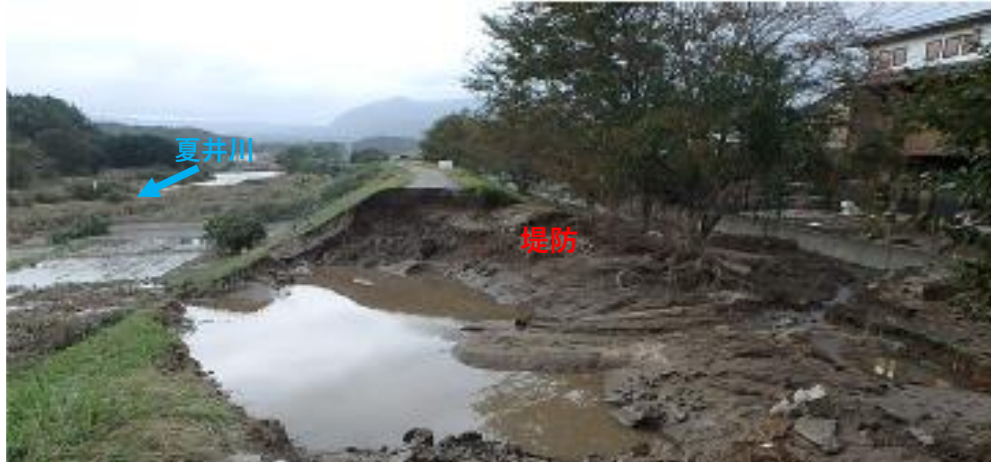
被災状況 (令和元年10月13日撮影)