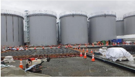
(写真3-1) 前回撮影(4月11日)