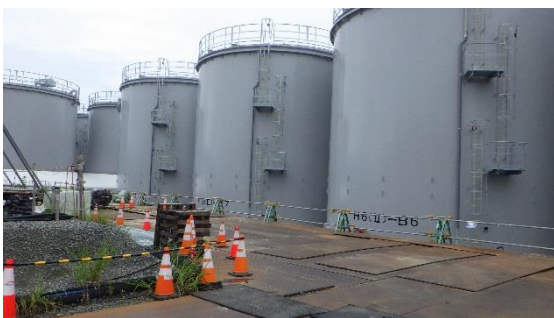
(写真2-3) 今回撮影(7月1日) タンクの塗装が完了していた