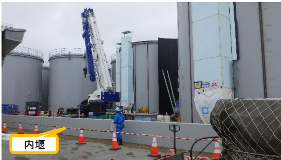
(写真3-2) 今回撮影(7月1日)