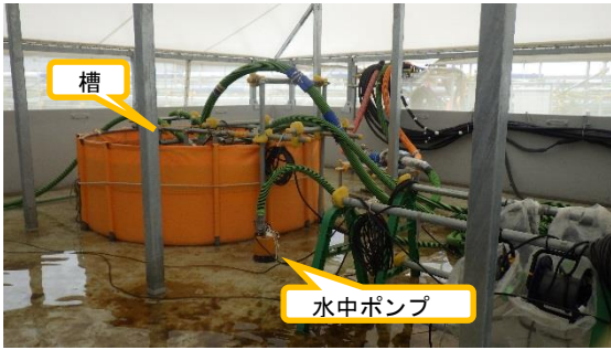
(写真1) エリアの南東端で撮影