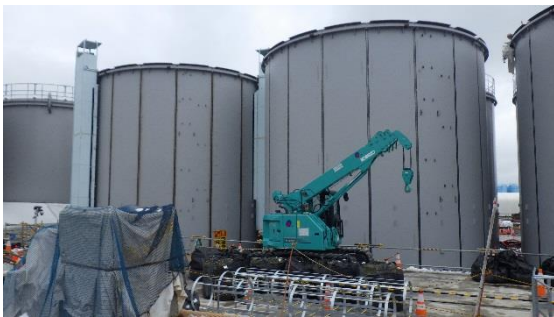
(写真2-2) 前回撮影(4月11日)