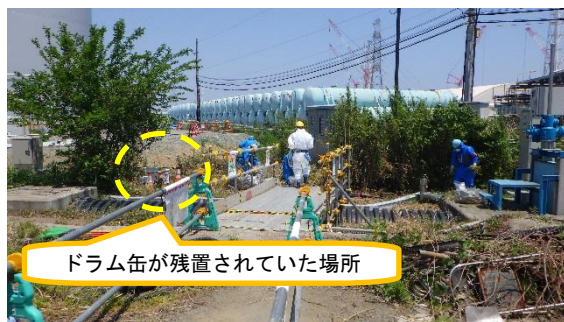
(写真 1 - 1) 前回 (令和元年 5 月 27 日撮影)