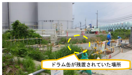
(写真 1 - 2) 今回 (令和元年 7 月 2 日撮影)