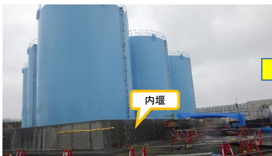
(写真 3 - 1) B南タンクエリア外観 (前回確認時 (平成 31 年 3 月 7 日) エリア北西側 から撮影)