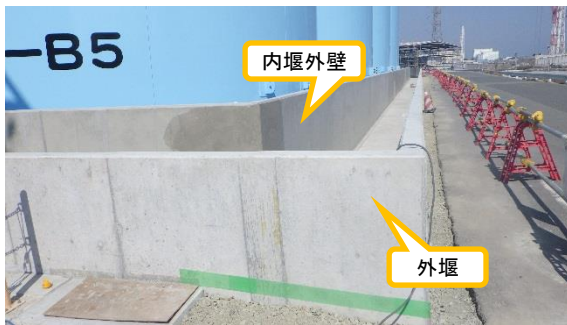
(写真 2 - 2) 内堰外壁及び外堰の状況 (被覆中) (南東側から撮影)