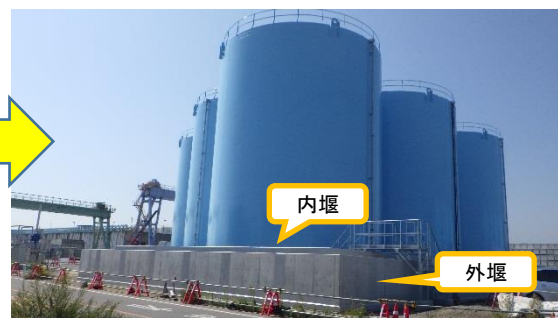
(写真 3 - 2) B南タンクエリア外観 (今回 (令和 元年 10 月 2 日) エリア北西側から 撮影)