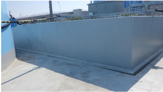
(写真 2 - 1) 内堰内側の状況 (被覆完了) (エリア南東側の例)