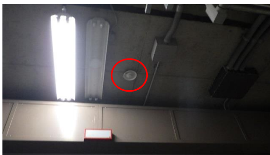
(写真3-1) 火災報知器(赤丸)