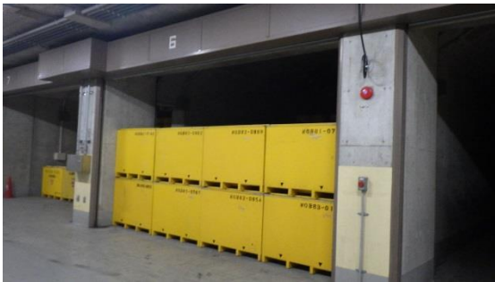
(写真1-2) コンテナによる保管の例 (第7棟の状況)