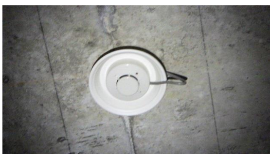
(写真3-2) 火災報知器を拡大 結露水が火災報知器に触れないよう に傘型の構造になっている。