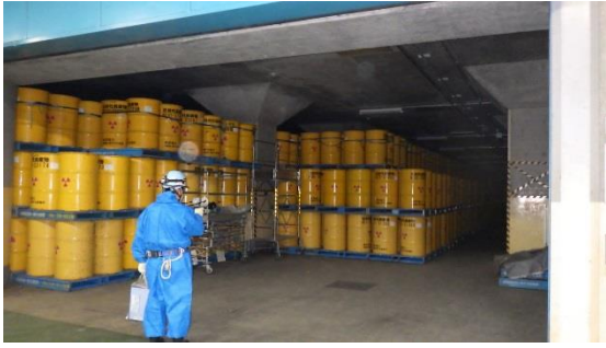
(写真1-1) ドラム缶による保管の例 (第6棟の状況)