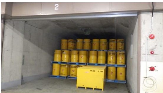
(写真1-3) コンテナによる保管の例 (第8棟の状況)