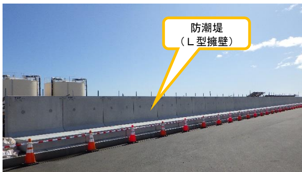
(写真4) 防潮堤(初回据付範囲)の全景 (北側から撮影)