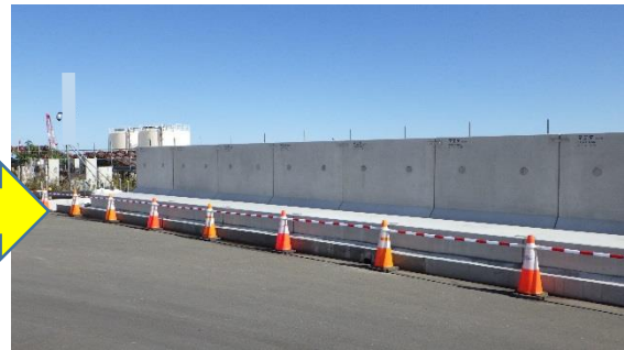
(写真3-2) 初回据付範囲北側の状況 (今回(10月23日)撮影)