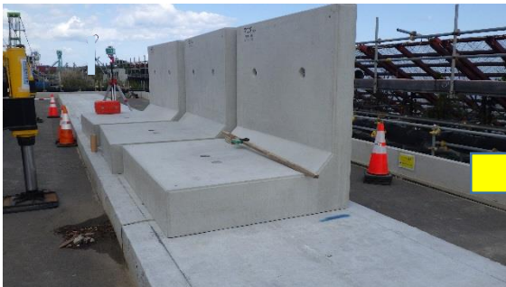
(写真3-1) 初回据付範囲北側の状況 (前回(9月25日)撮影)