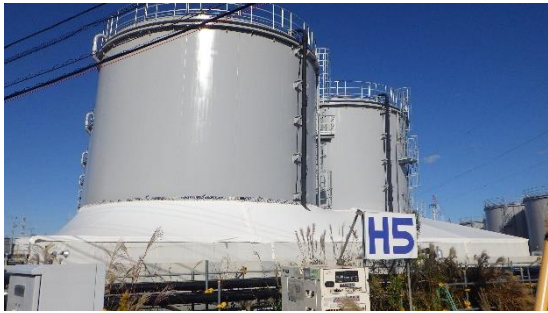
(写真1-1) H5タンクエリア外観 (エリア南部を南側から撮影)