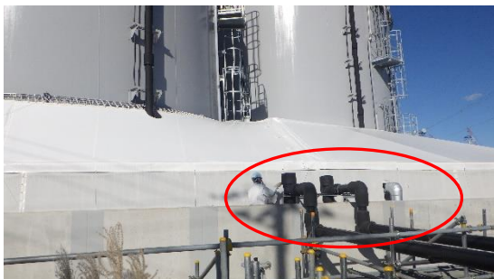
(写真1-4) 赤丸が移送配管