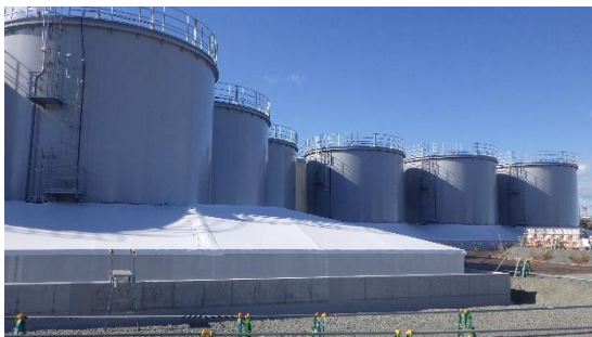
(写真1-3) H5タンクエリア外観 (エリア中央部を東側から撮影)