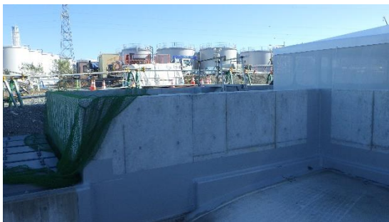
(写真2) 設置工事中の堰内雨水の排水設備