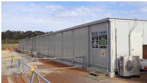
(写真 2 - 1) 休憩所外観