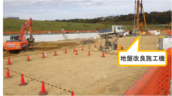
(写真 1 - 2) 南東側から撮影 (11 月 22 日撮影)