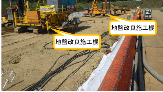
(写真 1 - 1) 南東側から撮影 (10 月 1 日撮影)