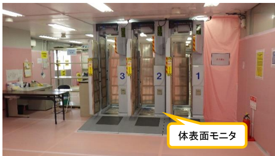
(写真 2 - 3) サーベイエリア