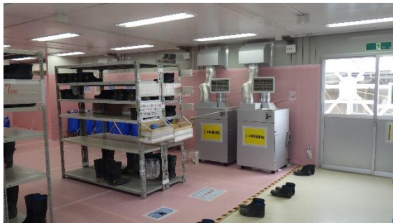
(写真 2 - 2) 装備脱衣エリア