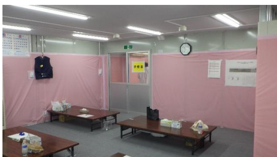
(写真 2 - 5) 休憩エリア