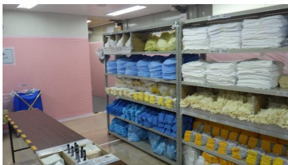
(写真 2 - 4) 装備着衣エリア