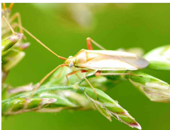
写真1 アカスジカスミカメ