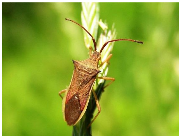
写真2 ホソハリカメムシ