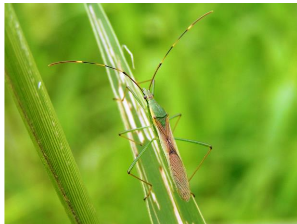
写真4 クモヘリカメムシ