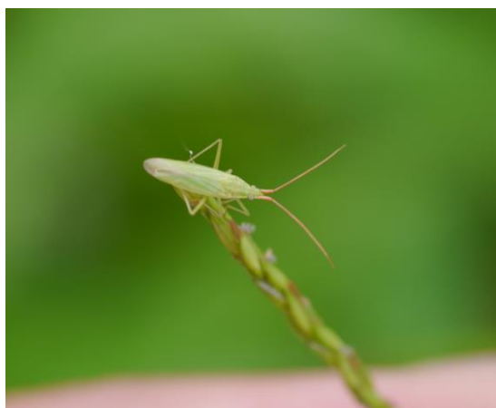
写真3 アカヒゲホソミドリカスミカメ