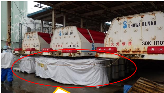
保管されているドラム缶