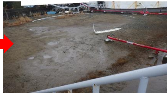
(写真1-2) 今回の状況 (令和2年1月28日撮影)