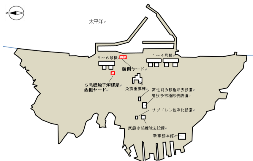
（図1）福島第一原子力発電所構内概略図