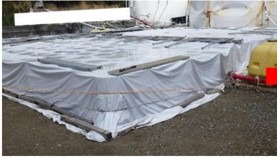
(写真1-1) 前回の状況 (令和元年5月7日撮影)