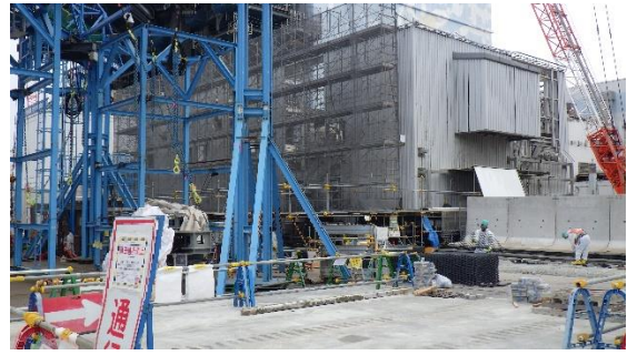
(写真1-2) 2号機原子炉建屋南西側から撮影 今回（令和2年2月10日撮影）