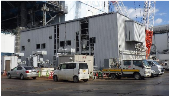
(写真1-1) 2号機原子炉建屋南西側から撮影 前回（平成31年2月18日撮影）