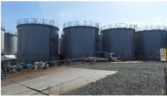
(写真1-1) タンクエリア外観