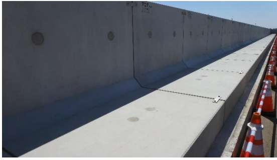
(写真1-4) 4号機タービン建屋東側の状況