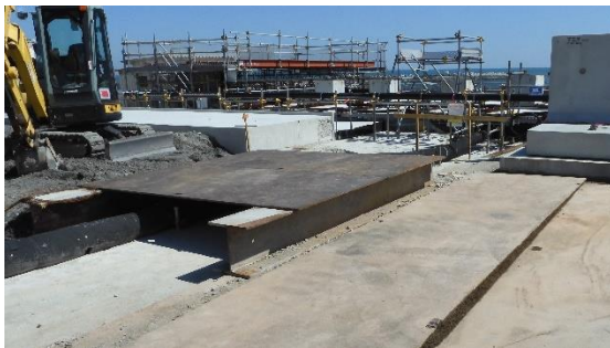
(写真1-2) 2号機タービン建屋東側の状況