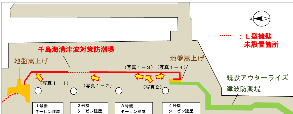
(図2) 千島海溝津波対策防潮堤詳細図