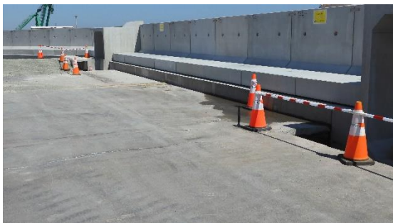
(写真1-1) 1号機タービン建屋東側の状況