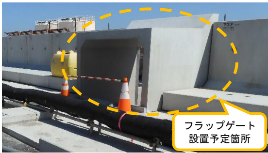
(写真2) フラップゲートの設置予定箇所の状況