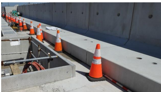
(写真1-3) 3号機タービン建屋東側の状況