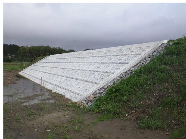
破堤箇所は川裏（住宅地側）も護岸工を実施しています。