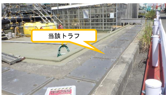
(写真1-1) 建屋内RO循環設備トラフの外観