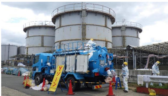
(写真1-1) タンクの残水移送作業の状況