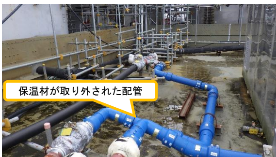
(写真2) 撤去予定の配管の状況