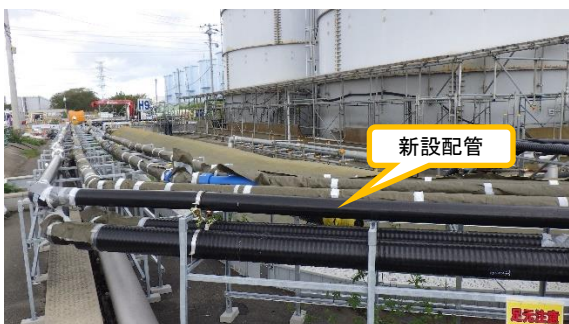
(写真3) 新設配管の状況