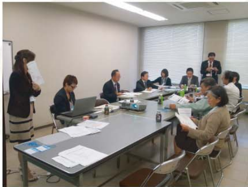
第1回クラスタ分科会の様子

10月19日(金)15:00から、いわき合同庁舎3階第2会議室にて、「いわき6次化産品試作プロジェクト 第1回クラスタ分科会」を開催しました。