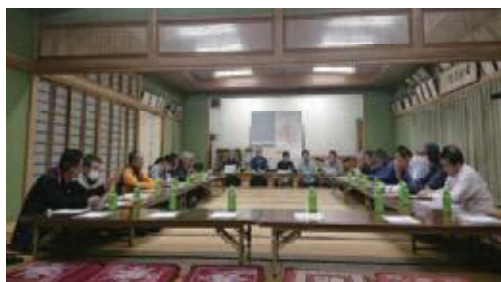
説明会方式による進行表(例)

この形式であっても、誰かが一方的に説明するのではなく、委員の皆さんが進行役を務めるなど、参加者全員が積極的に話し合いに加われるように工夫します。