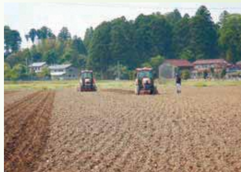
GNSSガイダンス・自動操舵システムによる大豆播種及び明きょ施工の様子