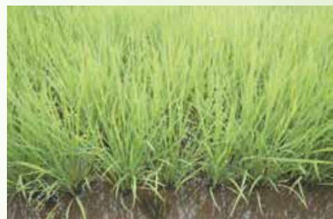
「福、笑い」現地実証ほ

※「福、笑い」は生産者登録制となっており、作付けには認証GAPの取得をはじめ、いくつかの要件があります。