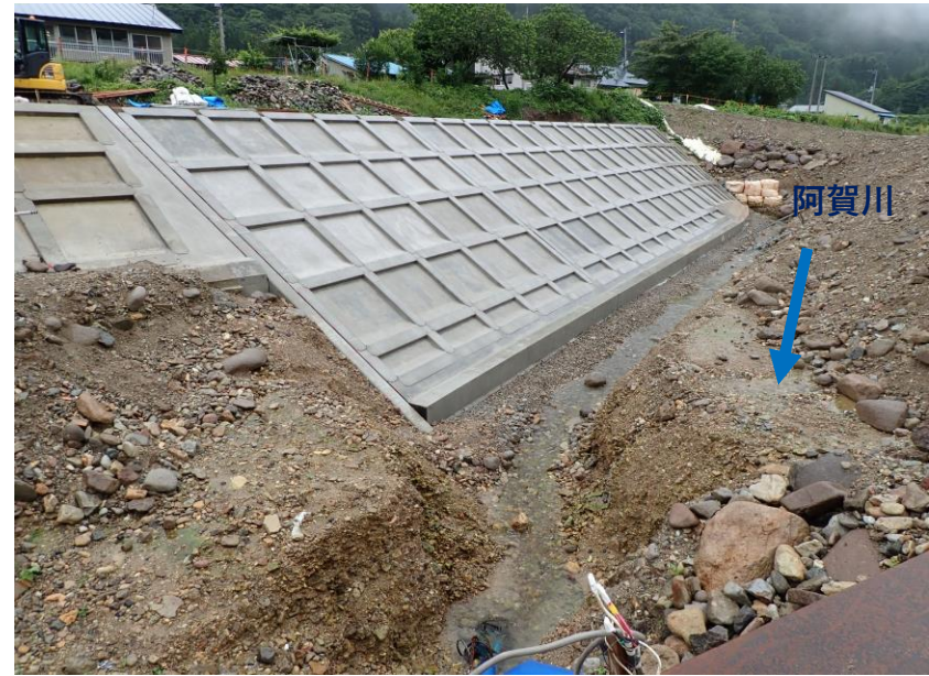
施工状況（令和2年7月18日撮影）