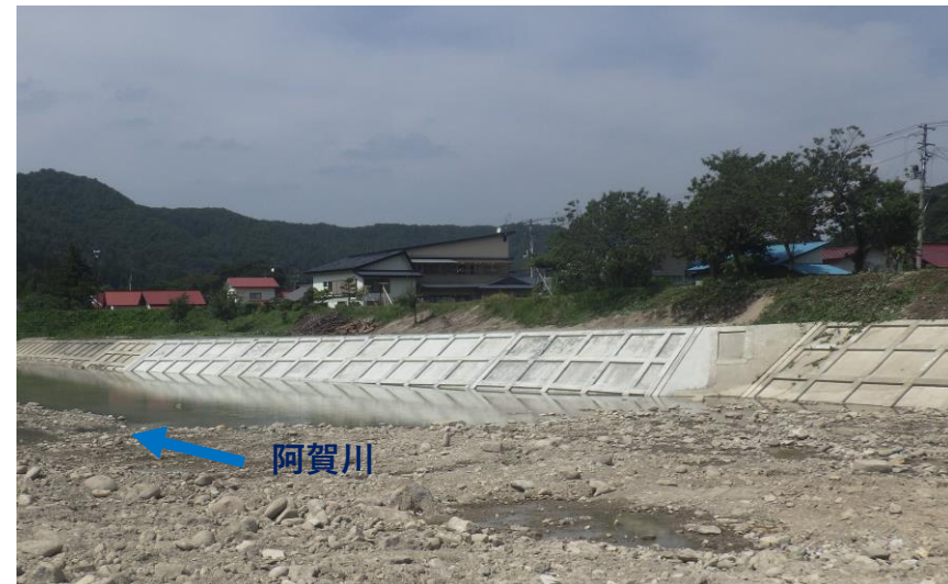
令和2年8月5日に工事が完成しました。