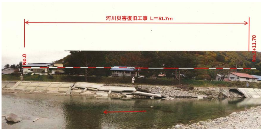
被災状況（令和元年10月撮影）