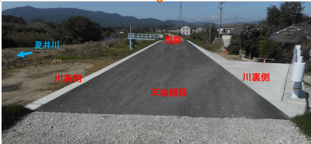
天端舗装完了 (9月末)