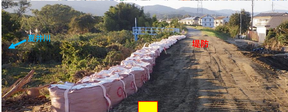
被災状況 (応急仮工事後)