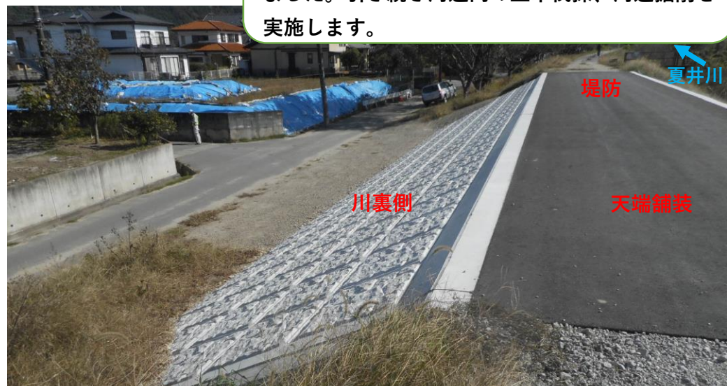
川裏側 コンクリート張ブロック完了（6月末）

令和元年東日本台風により破堤した堤防について川表側護岸、川裏側護岸、天端舗装が全て完了しました。引き続き河道内の立木伐採、河道掘削を実施します。