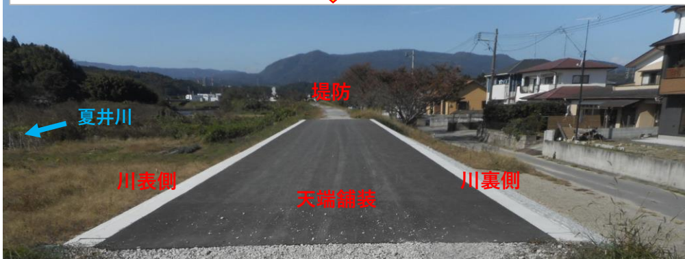
天端舗装完了（8月末）