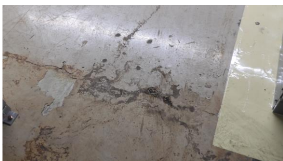
(写真 1 - 3) 乾いているが、過去に湧水したと思われる亀裂