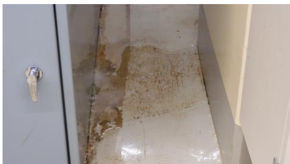
(写真 1 - 1) 電気品室床面の水溜まり