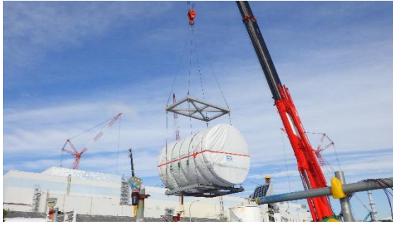
(写真1) 解体ブロックの吊り上げ状況