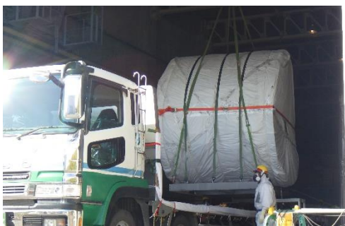
(写真3) 定検用機材倉庫Bでの荷下ろし状況