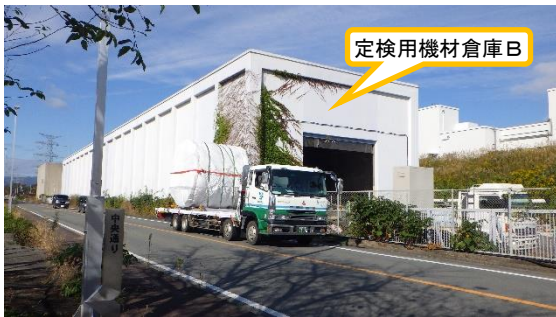
(写真2-2) 定検用機材倉庫Bへの運搬状況