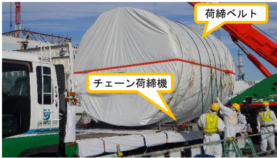
(写真2-1) 解体ブロックの固縛確認状況