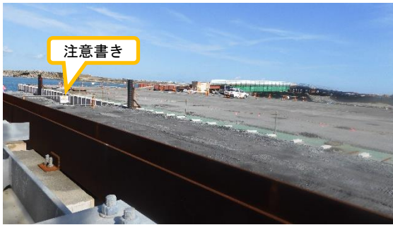
(写真5-1) 「端部開口部」の注意書き掲示状況