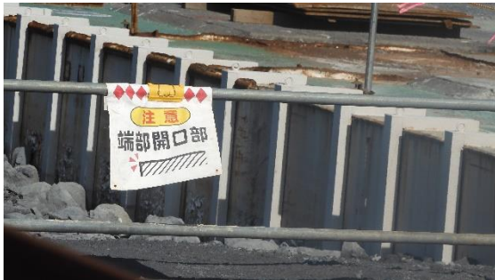
(写真5-2) 注意書き拡大