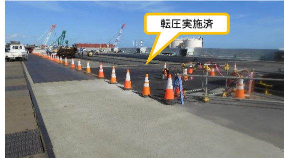
(写真 1 - 2) 同左 今回（令和2年10月27日）撮影