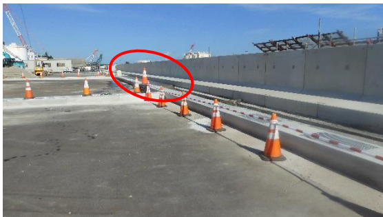
(写真 2 - 1) 3号機タービン建屋東側の状況