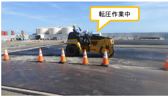
(写真 1 - 3) 転圧作業の状況