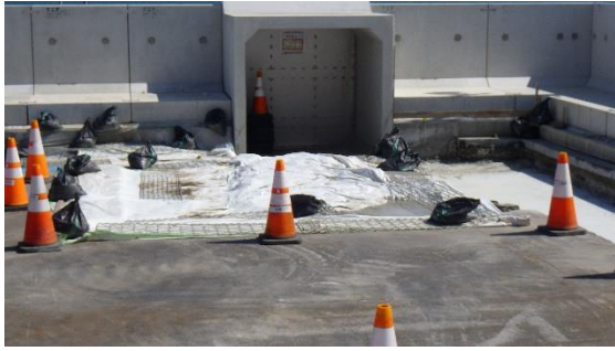
(写真3-1) 4号機タービン建屋東側の状況 前回(令和2年10月2日)撮影