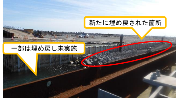
(写真4-2) 同左 今回(令和2年10月27日)撮影