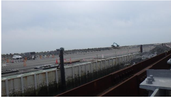
(写真4-1) メガフロート北西側の状況 前回(令和2年10月5日)撮影 北西側から撮影