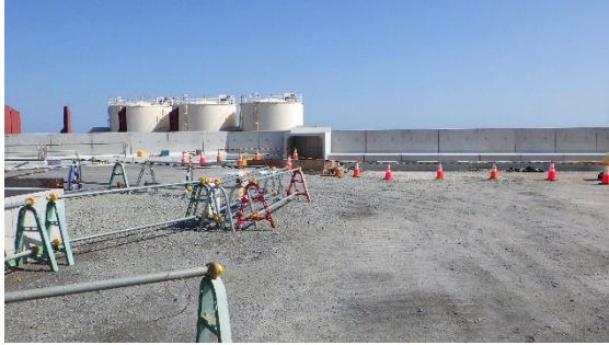
(写真 1 - 1) 1、2号機タービン建屋東側の状況 前回（令和2年10月2日）撮影