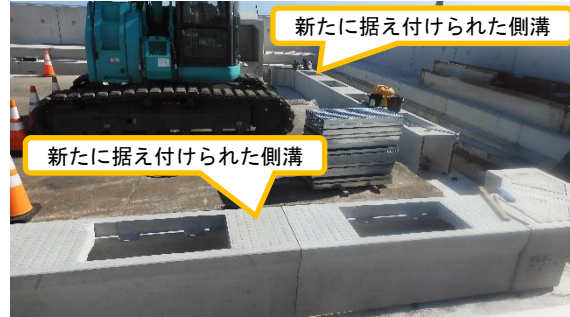
(写真3-2) 同左 今回(令和2年10月27日)撮影