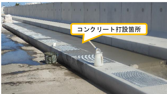
(写真 2 - 2) 写真 2 - 1 赤丸部分拡大 L型擁壁と側溝の間にコンクリート が打設されている