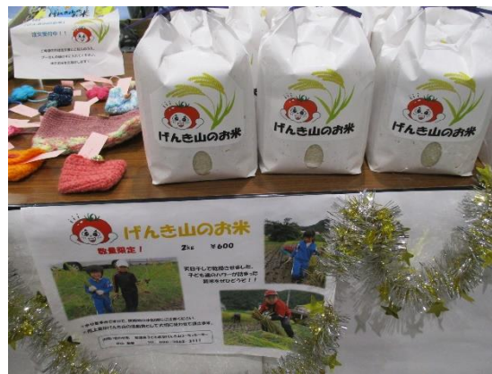
収穫した米の販売も