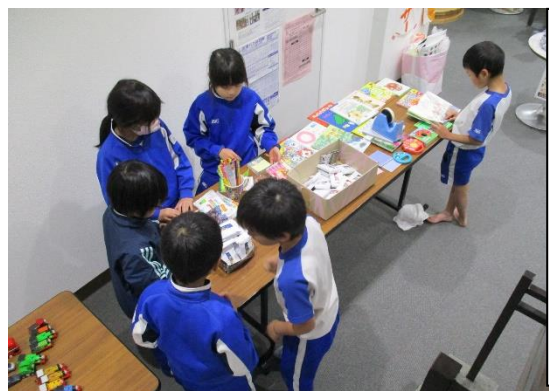
バザーの商品に興味津々

げんき山の活動を通して、南郷地域の活性化、そして地域の方々を元気にしていきたいです！