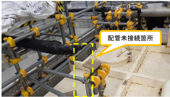
(写真 2 - 3) 前回 (9月30日) 撮影 中継タンクNo. 4側の移送配管の敷設 状況