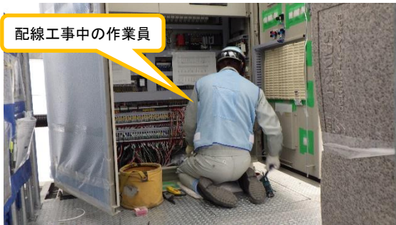
(写真1-2) 配線工事の状況②