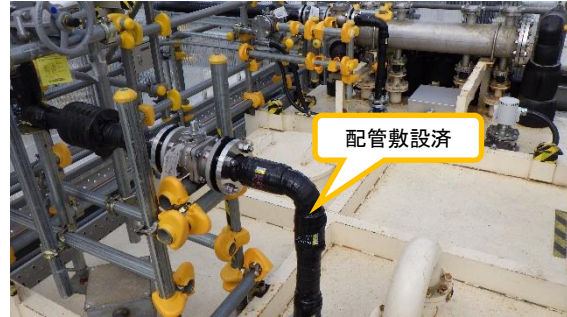
(写真 2 - 4) 今回撮影 同左