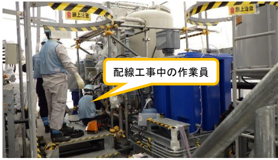
(写真1-1) 配線工事の状況①