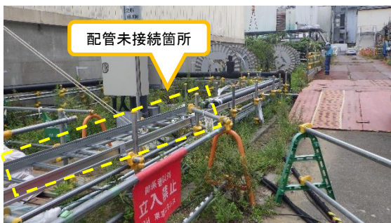
(写真2-1) 前回(9月30日)撮影 サブドレン除鉄装置側の移送配管の 敷設状況