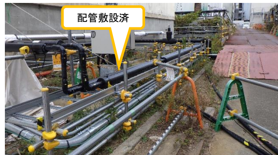
(写真2-2) 今回撮影 同左