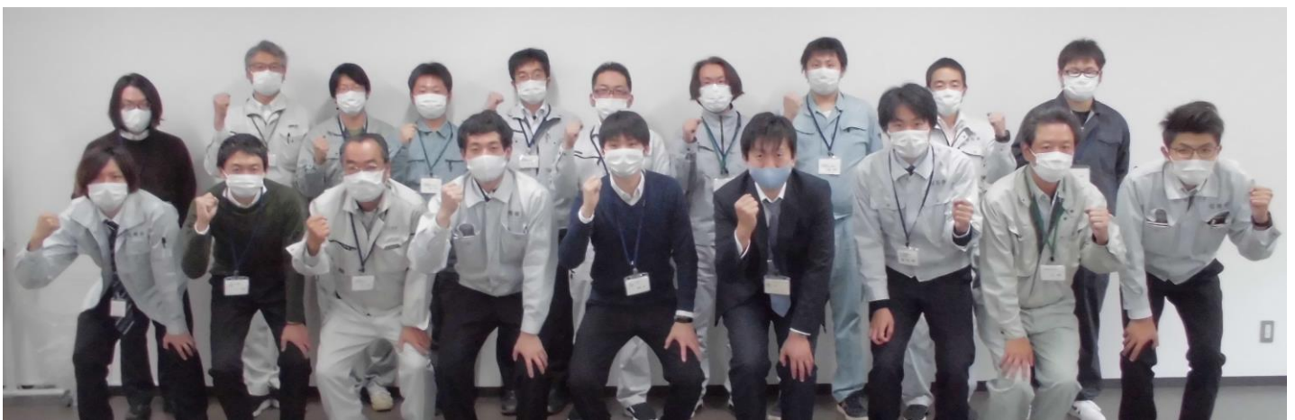
勉強会の参加者（民間の設計会社10名、県北建設事務所9名）