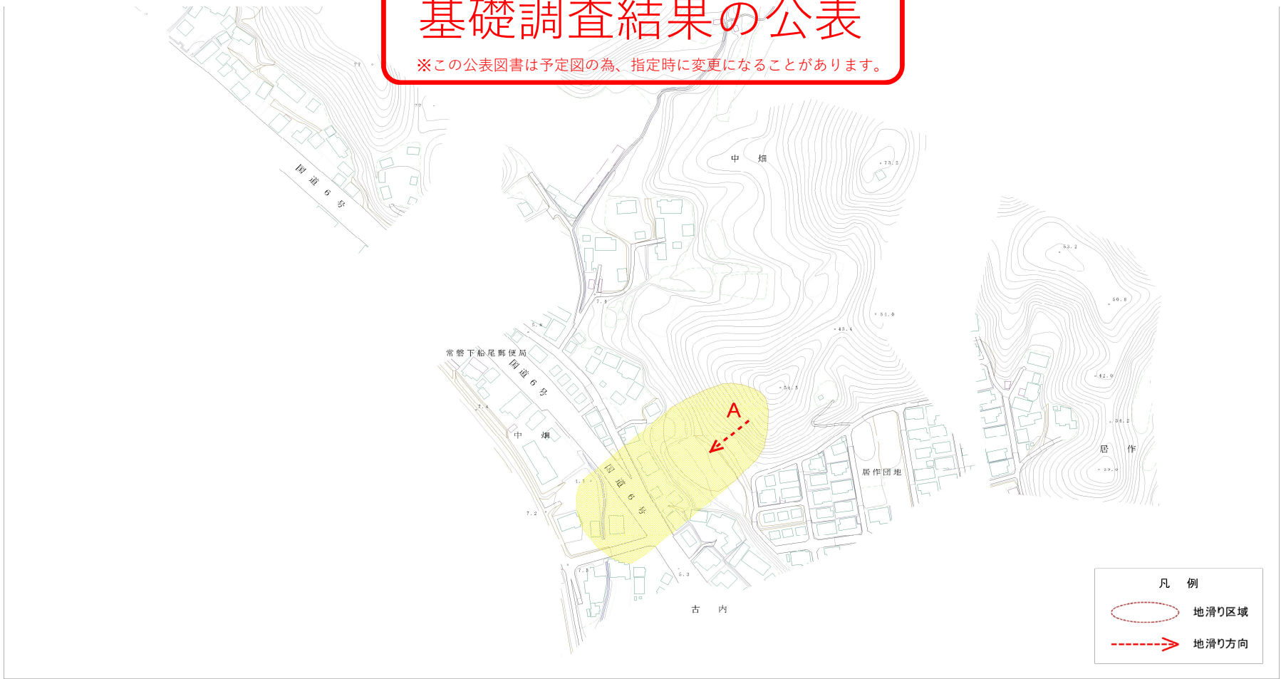
様式-2(地) 土砂災害警戒区域・土砂災害特別警戒区域 区域図